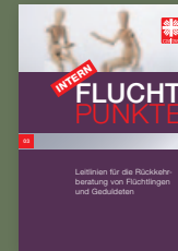
Fluchtpunkte intern 03/September 2017: Leitlinien für die Rückkehrberatung von Flüchtlingen und Geduldeten