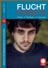
Fluchtpunkte 02/Februar 2014: Unbegleitete minderjährige Flüchtlinge