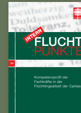
Fluchtpunkte intern 02/Dezember 2016: Kompetenzprofil der Fachkräfte in der Flüchtlingsarbeit der Caritas