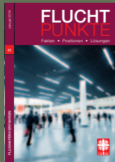
Fluchtpunkte 01/Januar 2014: Flughafenverfahren

In der Reihe „Fluchtpunkte“ sind bereits erschienen: