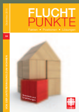
Fluchtpunkte 04/Dezember 2016: Von der Unterbringung zum Wohnen

In der Reihe „Fluchtpunkte intern“ sind bereits erschienen: