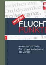
Fluchtpunkte intern 01/November 2014: Kompetenzprofil der Flüchtlingsberater(innen) der Caritas

In der Reihe „Fluchtpunkte intern“ sind bereits erschienen: